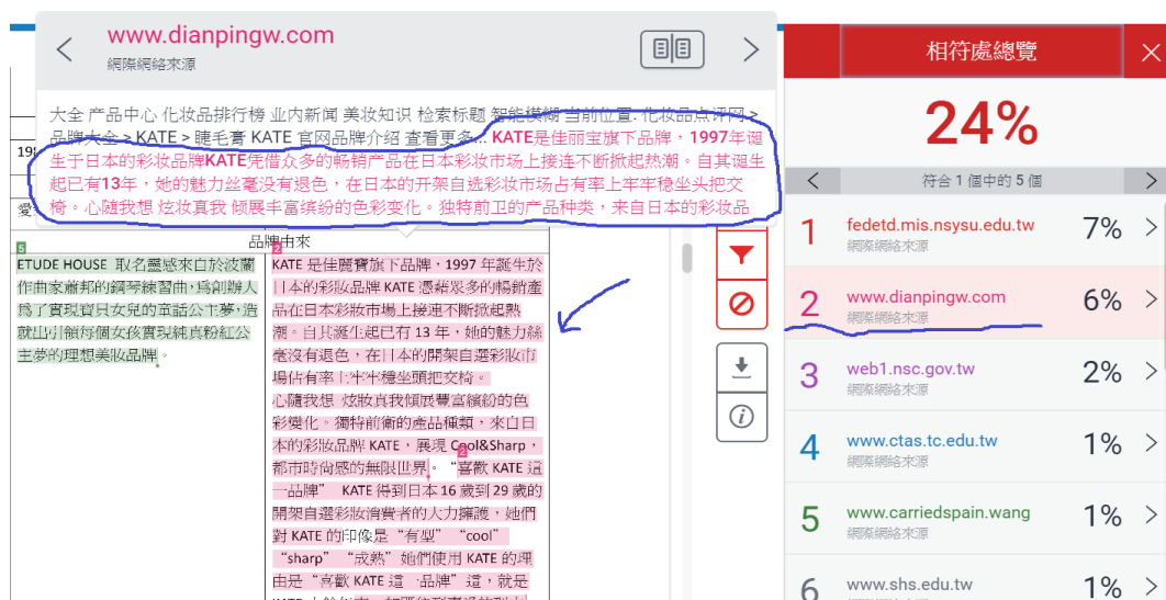
圖 2-8-2 以色彩標示相符文字