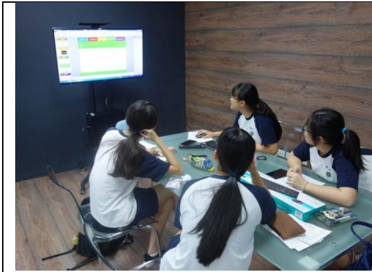
圖 3-1-3 封閉式討論空間區，透過裝潢隔間來隔離外界干擾，讓學生能安心專心自主學習討論與製作。