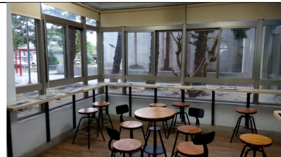
圖 3-1-6 開放式的討論空間較節省資源，可針對學生需求規劃圖書館局部空間成立閱讀角落建置。