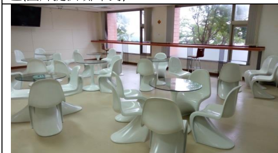
圖 3-1-7 在不干擾其他人員及空間運作下，規畫提供開放式的討論空間供學生使用。