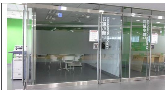
圖 3-1-1 封閉式討論空間區,空間設計及裝潢上需特別注意隔音問題,以免與其他空間產生干擾。

各校可依校內經費及現行空間,自行規劃合適場域,提供師生利用。以下僅就各校或公共圖書館討論間案例圖片,提供規劃參考。