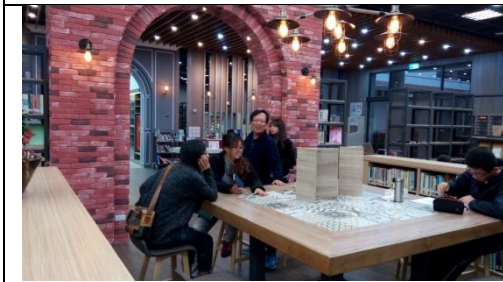
圖 3-1-5 半開放式討論空間，透過空間隔板或活動架，固定或暫時性隔離局部空間供學生作為討論區。