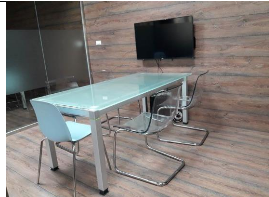
圖 3-1-4 經過妥善的設計規劃，可提供學生優質討論空間與設備，提升圖書館整體空間美感。