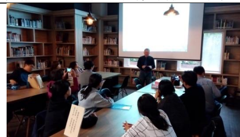
圖 3-1-10 是 20-50 人空間之討論室，亦可利用圖書館使用空間，規劃成開放式討論空間，作為講座、與作家有約等，具環繞書香氣息空間場域。