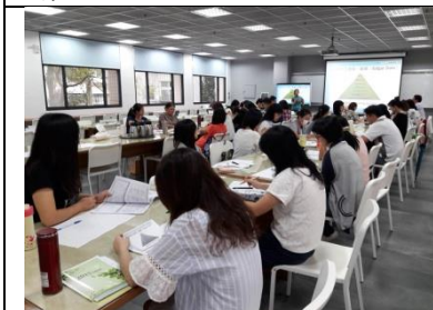
圖 3-1-9 是 20-50 人空間之討論室，以視聽服務為主，亦可作為班級共讀、定期節目欣賞、演講、研習、推廣活動、教育訓練等多功能使用空間。