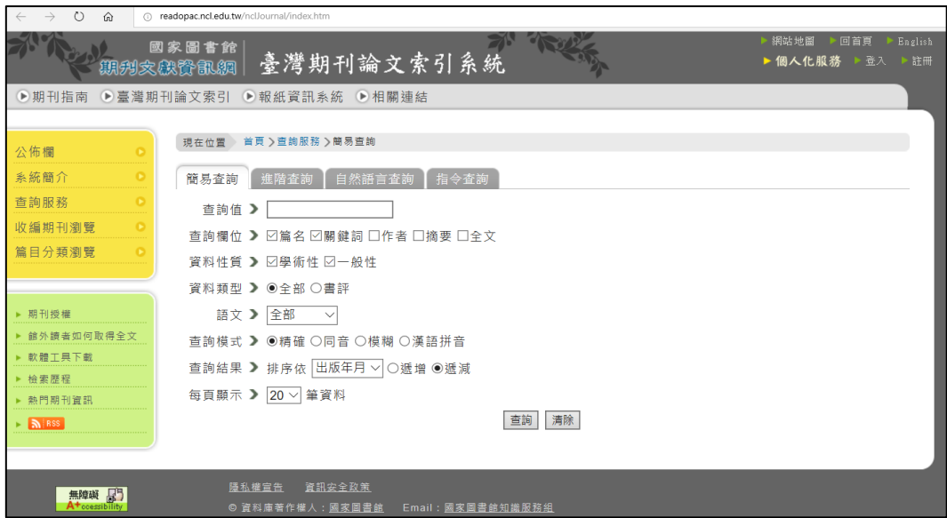
圖 5-2-2 國家圖書館：臺灣期刊論文索引系統