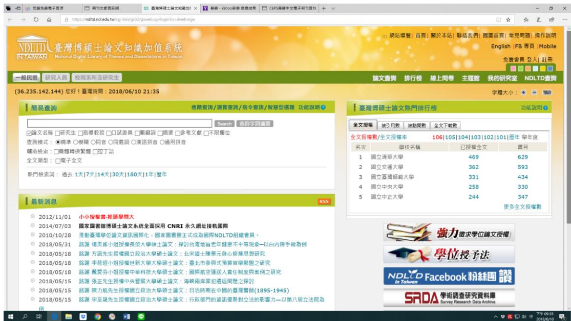
圖 5-2-3 國家圖書館：臺灣博碩士論文知識加值系統