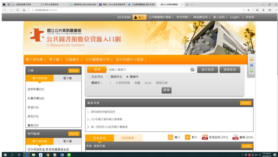
圖 5-2-5 國立公共資訊圖書館：公共圖書館數位資源入口網