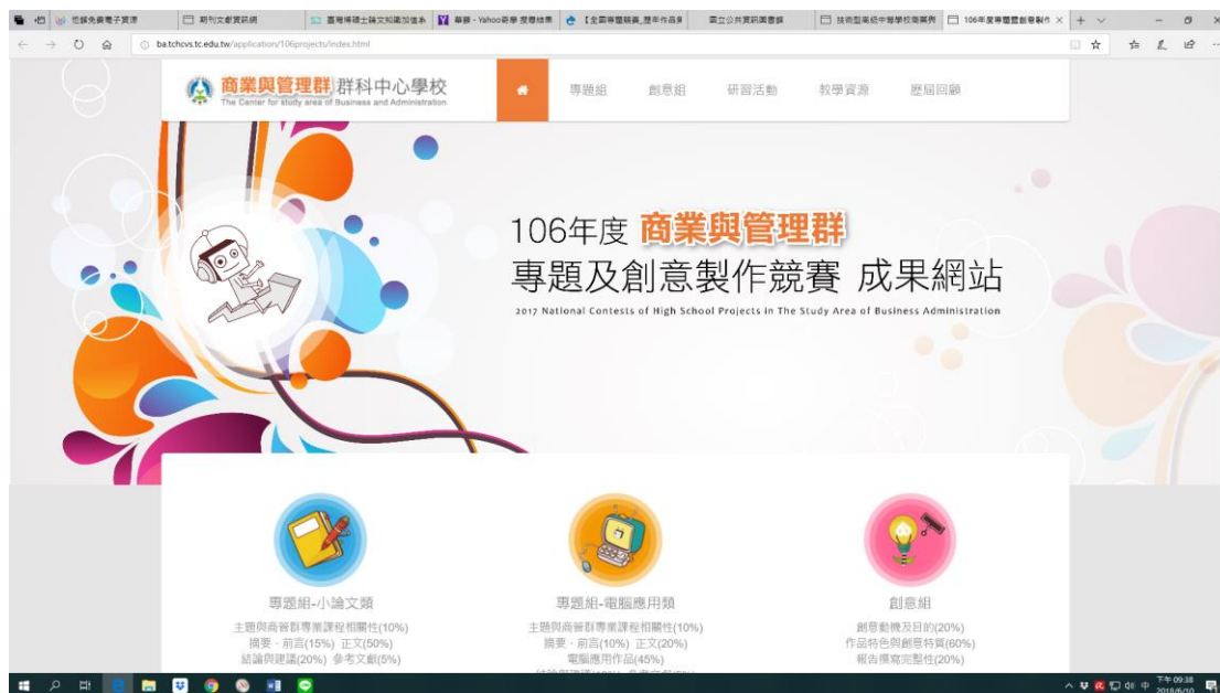
圖 5-2-6 商業與管理群群科中心網站：競賽成果網站